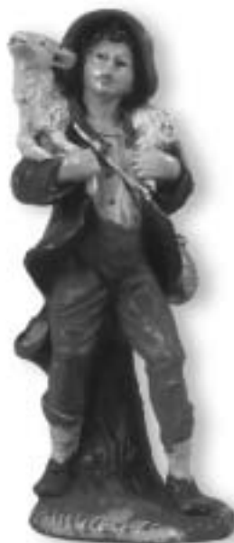
Il “buon pastore” del presepio popolare toscano

Come ogni tradizione popolare del presepio, anche quella toscana attinge a più fonti, contaminate, intrecciate tra loro e filtrate attraverso una selezione millenaria di temi iconografici: le cantate di Natale, già recitate nel medioevo e frequenti in Toscana, l’arte colta, i vangeli (sia i Sinottici che gli apocrifi), hanno fornito temi e personaggi. Benché assai semplice come struttura, il presepio toscano (che si faceva alla buona, con carta e sughero) rivela la mediazione delle trasformazioni dell’iconografia della Natività emerse tra medioevo e Rinascimento: in primo luogo l’abbandono della natività arcaica di origina siriana – che rappresenta una scena post-partum – in favore della Natività ispirata alla Visione di Santa Brigida, di austero misticismo. In secondo luogo, la scelta della “capanna” come luogo della Natività, al posto della “grotta” (che compare invece nell’iconografia più arcaica e sopravvive nel presepio meridionale). La capanna riflette meglio la lettura di Luca effettuata da Jacopo da Varazze, reintroducendo la scenografia urbana della mangiatoia al posto di quella antica, che ha per sfondo il de-