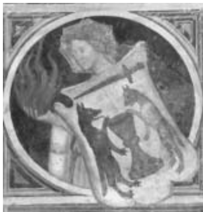
Stemma del Gonfaloniere di Giustizia (Prato, Palazzo comunale), inizio secolo XV.

Ben più difficile è qualificare il comune consolare come democratico quando si passa dal “come” al “quanti” e soprattutto al “quali” governano. Se democrazia significa governo dei più, contrapposto non solo a quello dell’uno, ma anche a quello dei pochi, non si può dire che i consoli fossero tanti. Il loro numero variabile, che poteva andare da due a ventiquattro (o qualcuno in più), mostra in maniera evidente la ristrettezza del vertice che essi rappresentano. Questo carattere aristocratico della res publica dell’età consolare è confermato