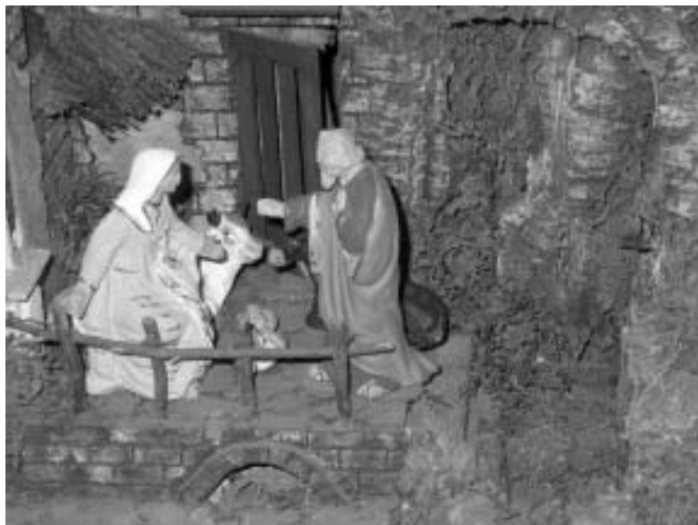
La grotta della Natività nel presepio popolare napoletano

serto: una trasformazione densa di messaggi teologici, come a sottolineare l'annuncio della buona novella nella città degli uomini.