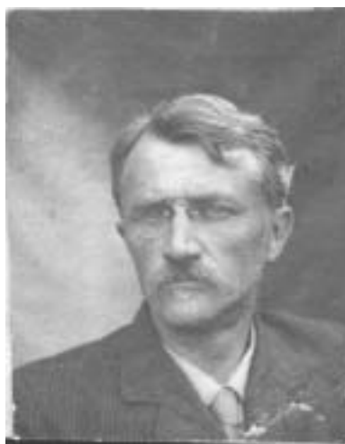
Fig. 2. Vladimir F. Šišmarëv

Vladimir Fëdorovič Šišmarëv (1875–1957) era filologo romanzo, allievo di Aleksandr Vesselovskij, accademico dal 1946. Laureatosi in filologia delle lingue romanze e germaniche all'Università Imperiale di S. Pietroburgo, nel 1899 perfezionò la sua formazione in Francia e in Italia con i maggiori filologi dell'epoca, tra cui Pio Rajna ed Ernesto Parodi. Negli anni 1918–1919 Šišmarëv fu anche uno degli organizzatori dell'Università per operai e contadini fondata nella città provinciale di Kostromá, svolgendovi, tra i primi, il ruolo di professore, e cumulando i nuovi impegni con l'insegnamento presso l'Università di Pietroburgo, dove era stato assunto nel 1903. A quell'epoca, come risulta dalle carte conservate nell'Archivio di Kostromá (cfr. il rendiconto dell'attività accademica svolta nell'a.a. 1918–19), risale l'inizio