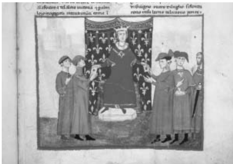
Roberto d'Angiò in trono.

persona contro il pericolo del risorgente ghibellinismo toscano. Le immagini del re punteggiano l'ultima parte della Cronica , e fra esse è di particolare interesse una (f. 215r; l. X,81) in cui il re è raffigurato in trono sotto una tenda che reca le sue insegne gigliate inserite spesso nello stemma pratese: un'immagine molto simile a quella dei coevi Regia carmina ascritti a Convevene da Prato, splendida opera miniata offerta dal comune al suo protettore; e simile forse alla statua che ornava la nicchia di Palazzo Pretorio fino al 1799.