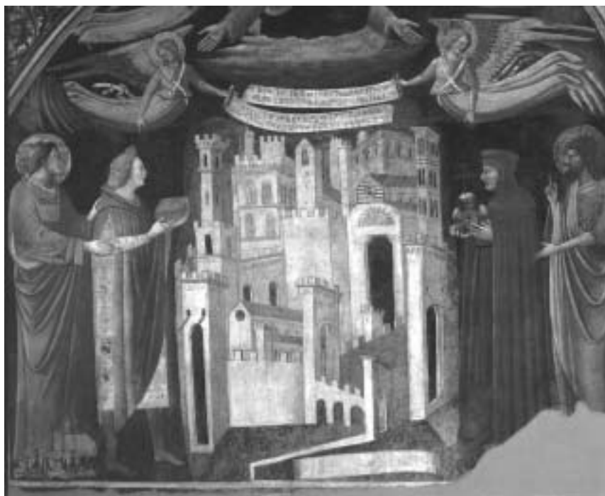
Veduta di Prato (inizio secolo XV) tra santi e benefattori (Palazzo Pretorio).

1. Muoviamo da un fenomeno noto. Fra XII e XIII secolo tutte le città dell'area comunale sono coinvolte in una trasformazione il cui aspetto più evidente è una sostituzione al vertice del governo urbano: non più gruppi di consoli appartenenti alle famiglie di tradizione militare, ma un vertice esecutivo unico, il podestà, forestiero, stipendiato, in carica per un periodo determinato e scelto dal consiglio della città che ha deciso di chiamarlo. Questo processo, noto come passaggio dalla fase consolare alla fase podestarile, ha molte componenti intrecciate, che per chiarezza possiamo separare nell'esposizione. C'è un piano sociale : la popolazione fra XII e XIII secolo è cresciuta, si affacciano alla scena politica e prendono a comparire nei consigli gruppi di famiglie di ricchezza piuttosto recente. Sono parentele che hanno anche una componente di ricchezza mobiliare (traffici, mercatura, prestito) e sono legate solo in modo secondario all'aristocrazia consolare. Queste famiglie pongono oggettivamente con la loro stessa esistenza il problema di un'apertura - sia pure controllata - dell'apparato politico. Sul piano delle istituzioni è importante notare che il passaggio non consiste affatto, come talvolta si ripete, in una semplificazione dell'apparato di governo. Al contrario, è un processo di complica-