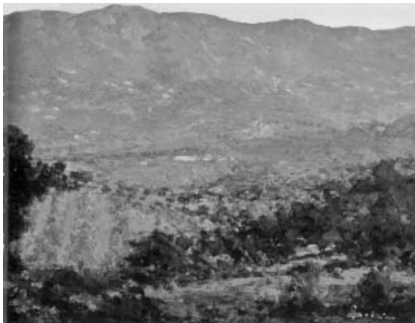
G. Dolci, La Calvana (acquerello, 1936).

ponesse il fenomeno carsico, da cui si propagano pianori caratterizzati da un paesaggio siccitoso e da frequenti passaggi d'intemperie settentrionali. Inoltre, alcuni botanici parlano di «elementi balcanici orientali», configurando una zona d'incontro con antiche migrazioni pannoniche, segnate da una preferenza per il quercus cerris su ripe calcaree, in luogo del castagneto; la migrazione del cerro unito ad acero, olmo e nocciolo, dai 300 ai 700 metri su tutti e due i versanti, sarebbe giunta qui scorrendo attraverso il Mugello a partire dal Casentino, e trovando aiuto in quel paesaggio pliocenico che doveva caratterizzare il primo rilievo di questa soglia montuosa, mediante una impercettibile inclinazione verso l'Adriatico 7 .