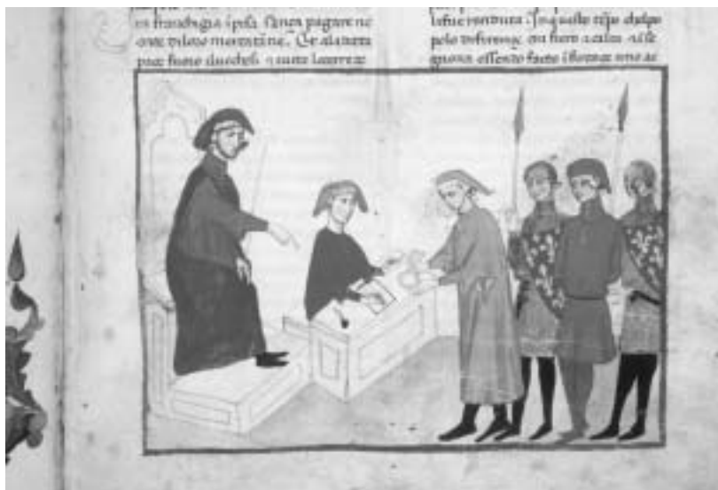
I Pratesi riportano un malfattore fiorentino a Firenze, episodio della Cronica di Giovanni Villani (1293).

Queste posizioni politiche trapelano qua e là non solo dal racconto dell'autore, ma anche dalle immagini del codice Chigi (che secondo l'interpretazione dei curatori, per vari indizi, potrebbe essere stato compilato sotto la diretta supervisione del Villani stesso), come ha mostrato per campioni la curatrice dell'opera, Chiara Frugoni, oggi tra i maggiori esperti in Italia del rapporto fra testo e immagine nella cultura medievale. Le immagini mostrate sono state attentamente selezionate proprio sulla chiave di una lettura sintomatica, rivelata da dettagli a prima vista trascurabili, che ne mette in rilievo il "non detto": il trasparire cioè, talora irriflesso, talora programmato, di pregiudizi e di particolari punti di vista tutt'altro che neutrali, sia sulla politica, sia sulle scelte religiose, sia a proposito delle credenze dell'epoca (come il malevolo punto di vista sugli ebrei).