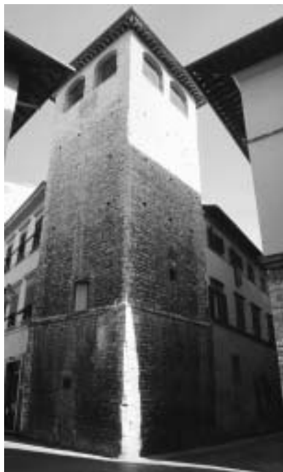
Torre gentilia nel centro di Prato (via Cairoli).

talune città precoci a fine 1100, di milites e di popolo che riempì quasi tutto il 1200.