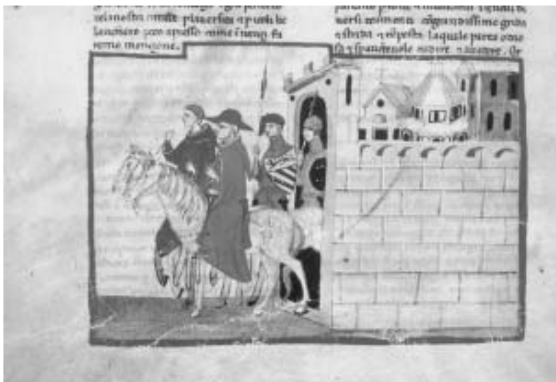
Il cardinale Niccolò da Prato, inviato a Firenze dal pontefice nella primavera del 1304 per rappacificare Bianchi e Neri: dalla Cronica di Giovanni Villani.