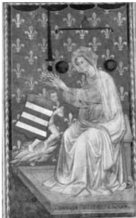
Allegoria della giustizia (Prato, Palazzo comunale), inizio secolo XV.

l'applicazione di un criterio di reclutamento fondato sulla residenza in uno dei quartieri cittadini, le nuove ripartizioni urbane che nascono al fine di spezzare precedenti rapporti familiari e clientelari 17 .