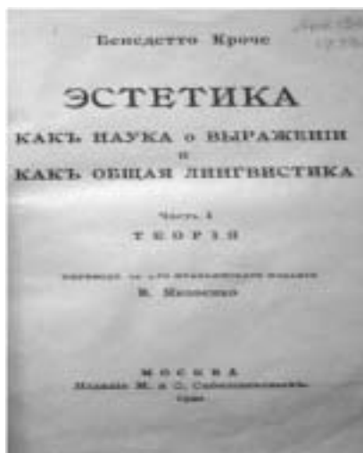
Fig. 1. Frontespizio della traduzione russa del 1920

periodo 1912-1942, conservate nell'Archivio della Fondazione Croce. Ne riportiamo i passi che trattano della traduzione dell' Estetica . La prima lettera scritta da Jakovenko è in data Mosca, 21 VII 1912 3 :