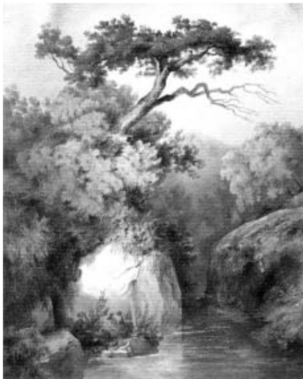
E. Benini, Rio Buti (acquerello 1845-50).